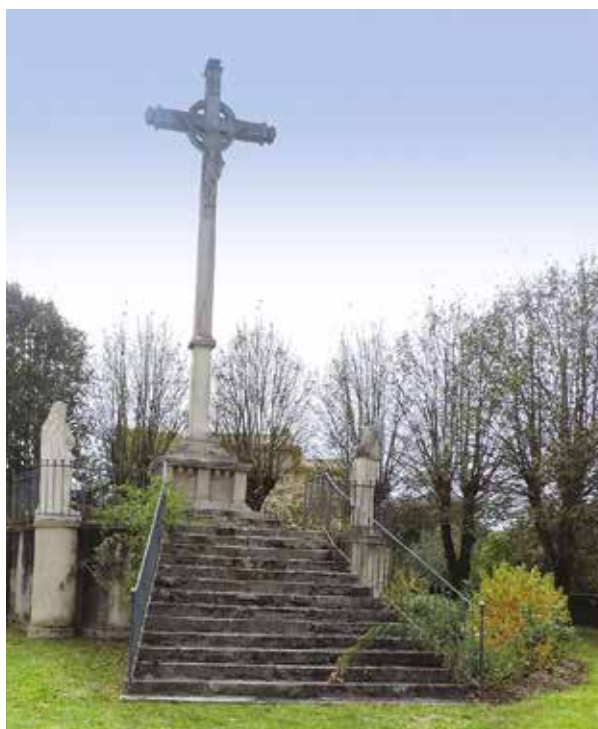
Le calvaire du Bon Dieu Noir (1930) situé à l'intersection de la route de Rocheservière, de Saint-André et de l'avenue de l'Atlantique remplace une ancienne croix en bois du XVIII ème siècle.