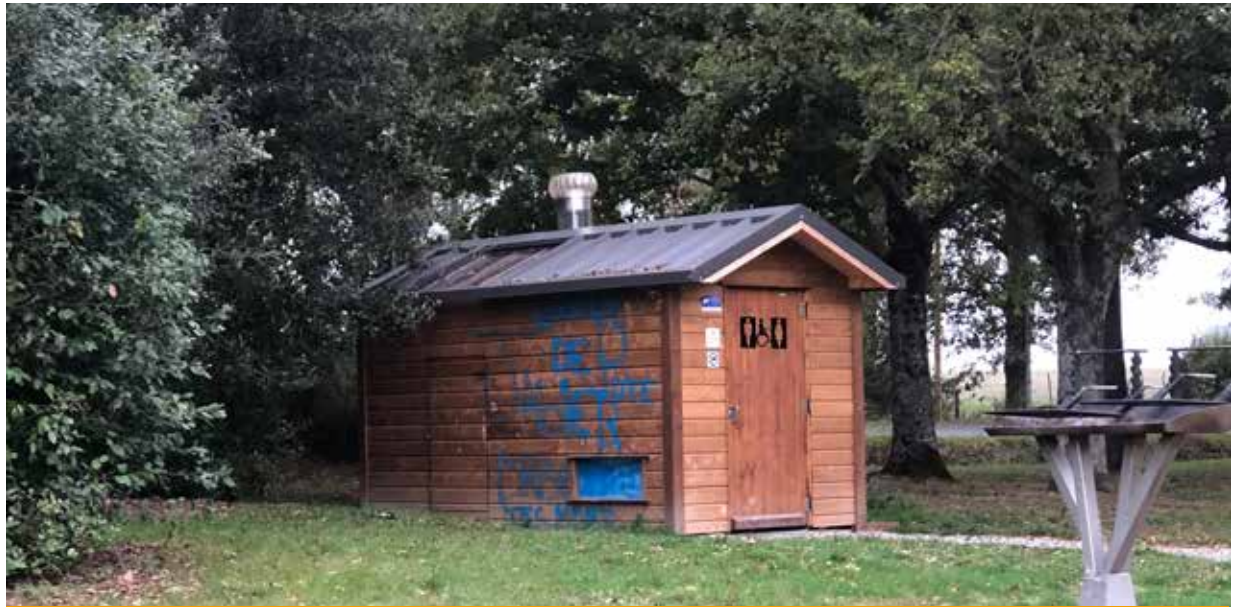
Toilette sèche au lac des Vallées taguée fin septembre 2022

Les incivilités sont des comportements qui ne respectent pas tout ou partie des règles de vie en communauté. Ils vont du simple respect d'autrui à la courtoisie en passant par les dégradations, troubles du voisinage, sacs poubelles abandonnés, deux roues roulants à vive allure avec ou sans pot d'échappement bruyant, ou encore l'oubli du ramassage de déjections canines. Les incivilités nourrissent une spirale de dégradation et de déclin difficile à enrayer si elles ne sont pas traitées immédiatement.