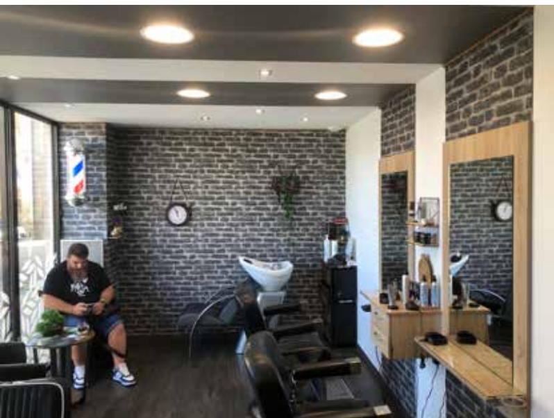
Salon côté hommes

Nous leur souhaitons à tous une très bonne continuation... » ■