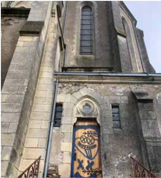
Porte de l'église taguée fin septembre 2022